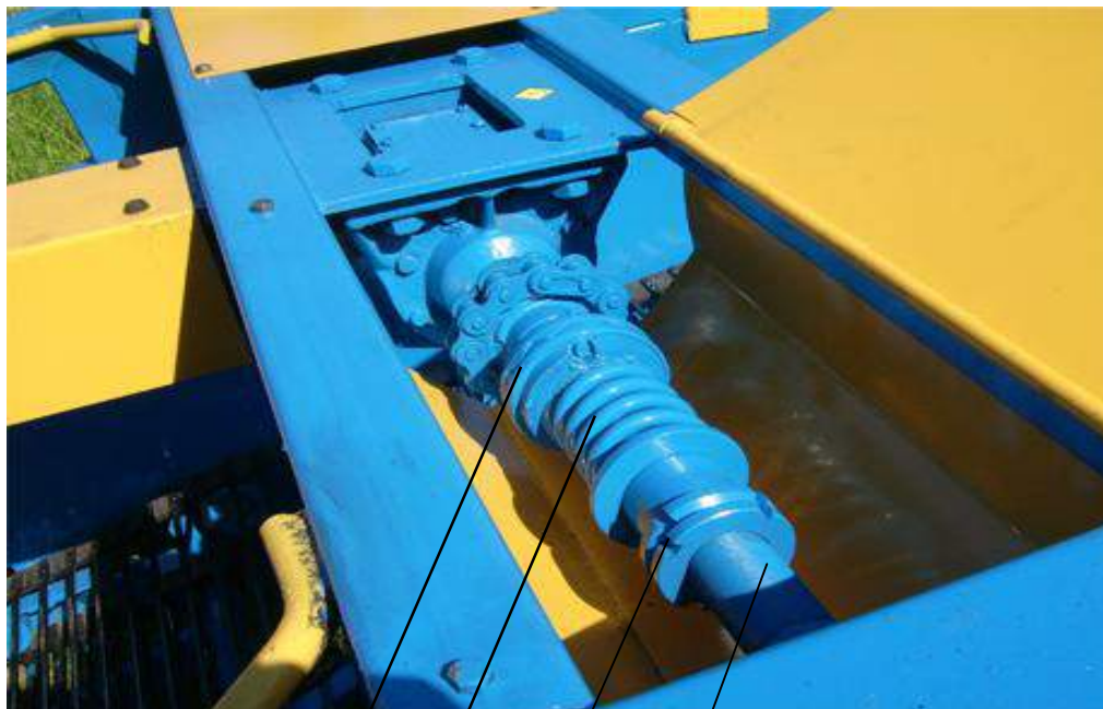
Рис. 3 – муфта предохранительная.

1 – пружина; 2 – гайка; 3 – вал; 4 – шайба зубчато-фрикционная.